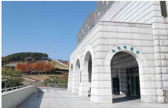
A. 동래읍성 복원_미션3(실외 활동)