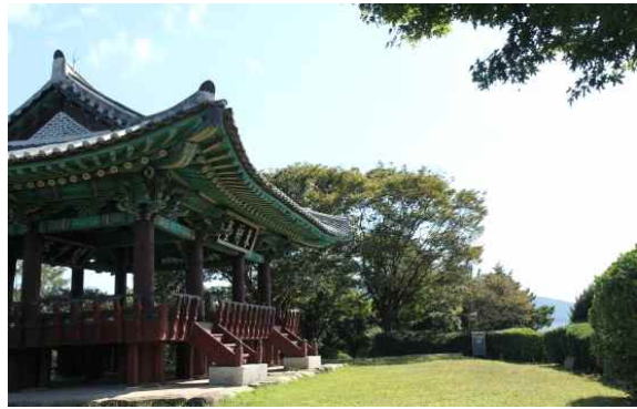
B. 온정용문_미션2(실외 활동)