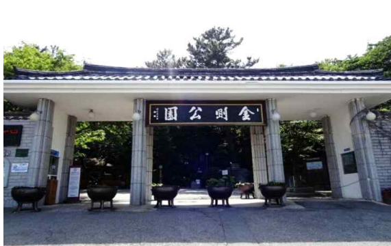
B. 금강공원_미션3(실외 활동)